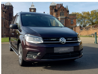
VW CADDY 2015+