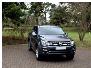
VW AMAROK V6 2016+