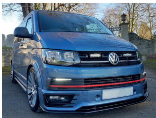
VW TRANSPORTER 6 2016+