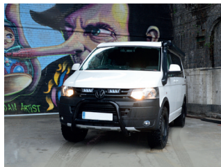
VW TRANSPORTER 5 2010+