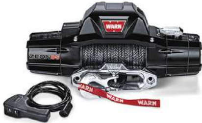
Version corde synthétique